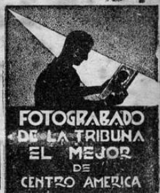
FOTOGRAFADO DE LA TRIBUNA EL MEJOR DE CENTRO AMERICA

unos 100 kilómetros de la costa. Las autoridades declararon que el oscurecimiento fué permanente y efectivo.